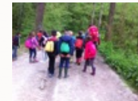
classe de dépaysement

Nous citons à titre d'exemple, à travers la lecture, les projets vécus en partenariat avec la bibliothèque, le théâtre, la psychomotricité, le sport, la natation, les excursions de cycle, les classes de dépaysement de cycle.