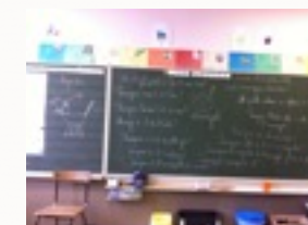
enfant acteur de leurs apprentissages

Nous citons à titre d'exemple, le tri des déchets, l'utilisation de gourde et de boîte à collations en primaire, de collations saines et collectives en maternelle, l'embellissement des locaux par les projets artistiques vécus en classe, l'aménagement des espaces extérieurs par une sensibilisation de nos enfants à l'environnement et le développement durable (poulailler, hôtels à insectes, élevage de coccinelles...)