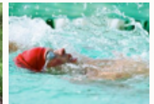
Natation dès la P1